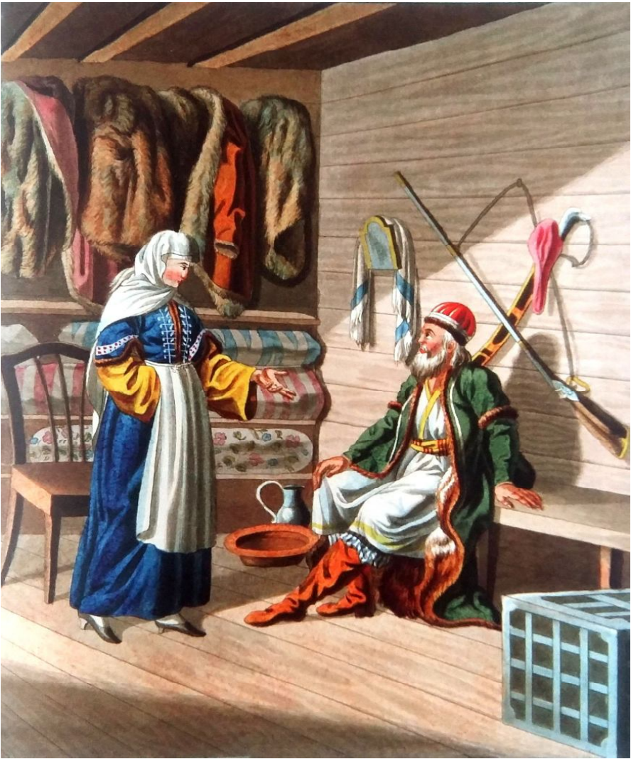
10. Гребенские казаки в начале XIX в. (по рисунку Е.М. Корнеева)