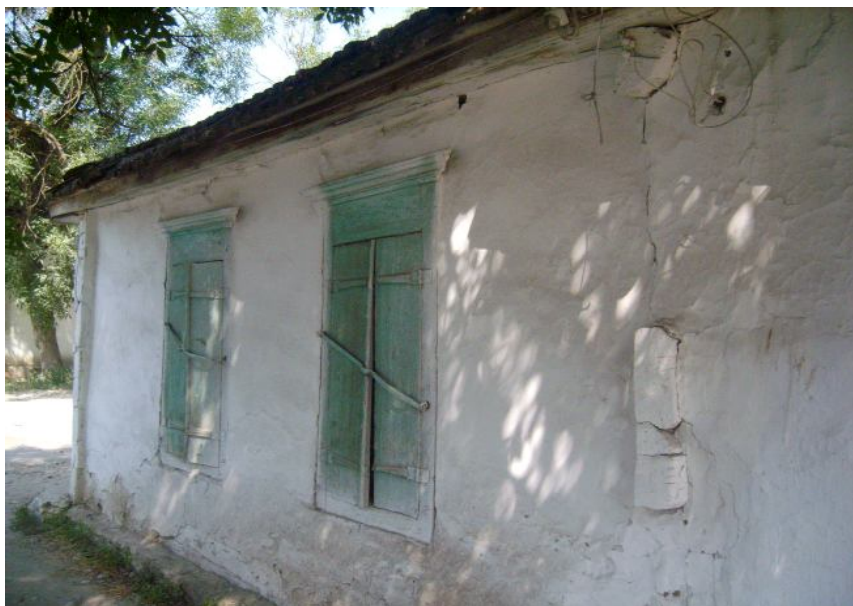
6. Традиционный казачий дом. Город Прохладный