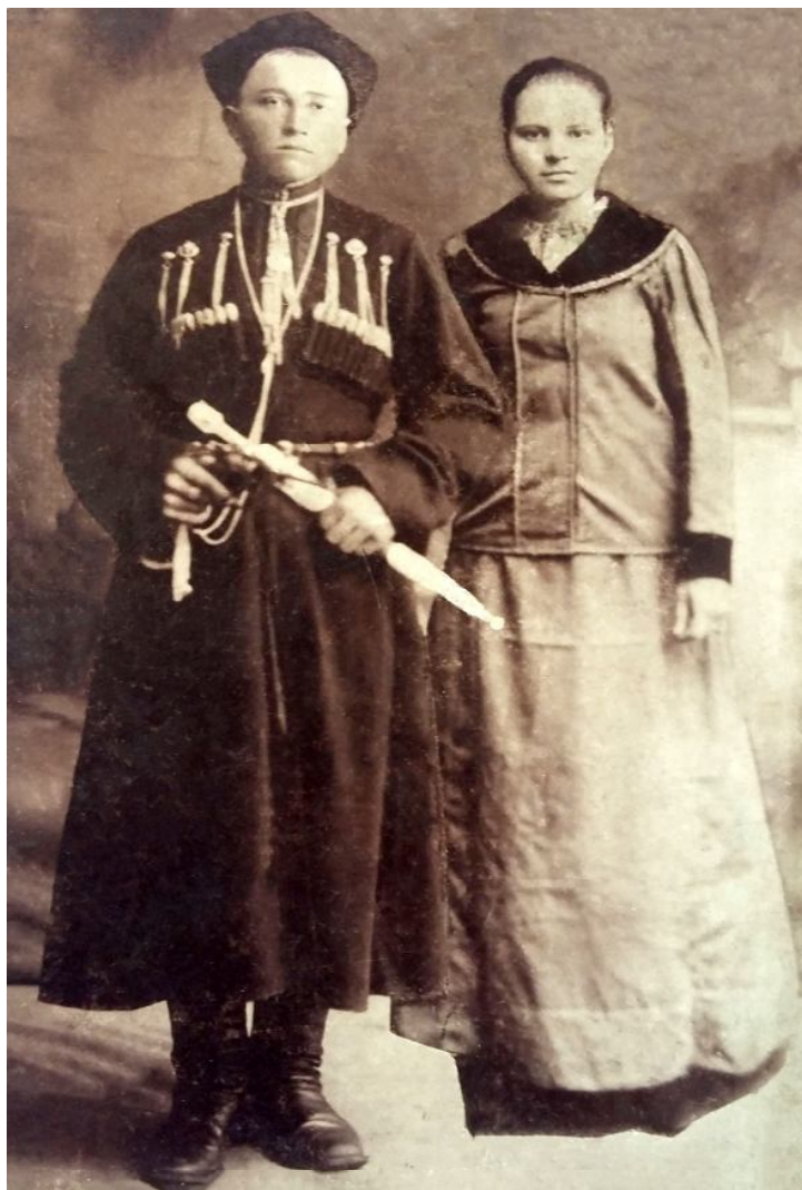
18. Терские казаки в начале XX в.