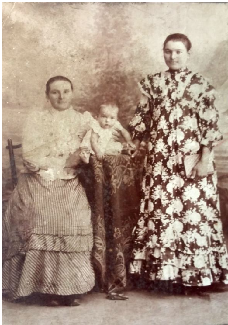
16. Терские казачки с ребенком. Фото начала XX в. из музея ст. Котляревской