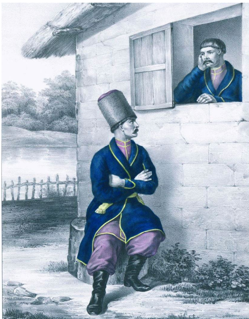
9. Казаки Моздокского казачьего полка. 1774 г. (из книги «Историческое описание одежды и вооружения российских войск». Ч. 6. СПб., 1847. Рис. 809)