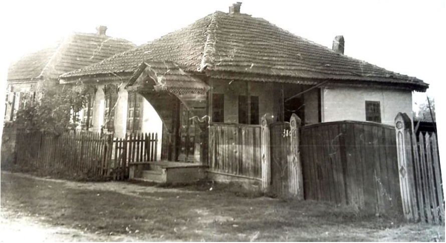
1. Традиционный казачий дом.