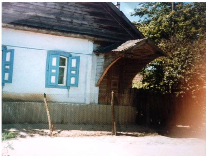
4. Традиционный дом. Ст. Екатериноградская