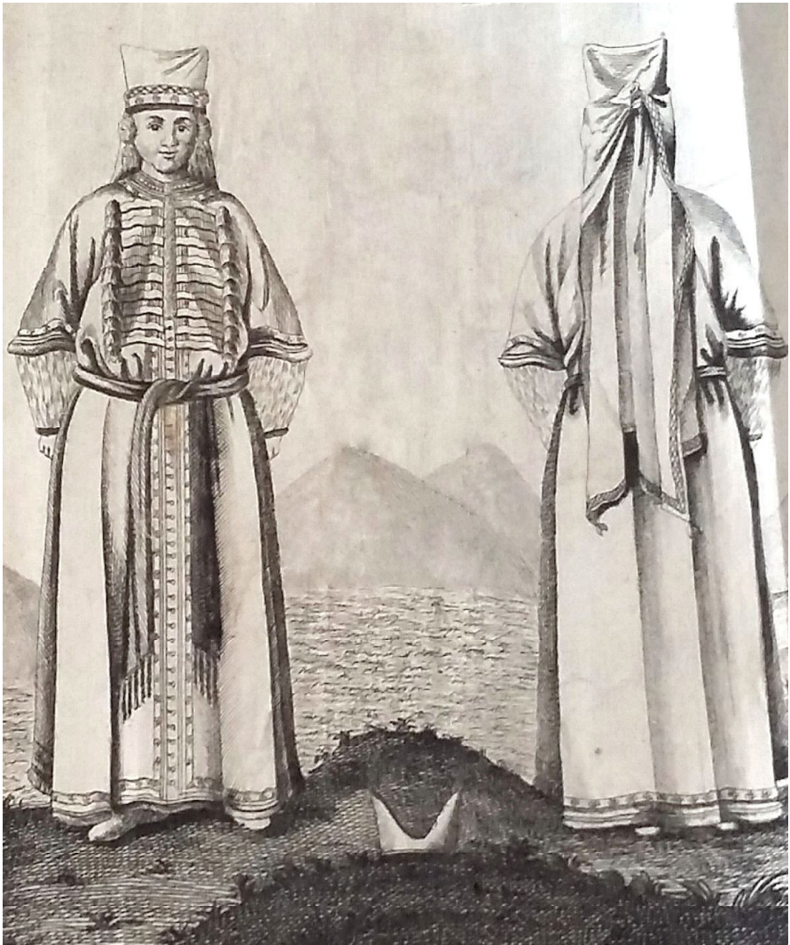
7. Терская казачка (из книги И. Гильденштедта «Reisen durch Russland und im Caucasischen Gebürge», hrgg. von P.S. Pallas. I. SPb., 1787)