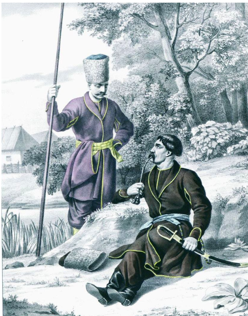
8. Кизлярский и Астраханский казаки. 1774 г. (из книги «Историческое описание одежды и вооружения российских войск». Ч. 6. СПб., 1847. Рис. 808)