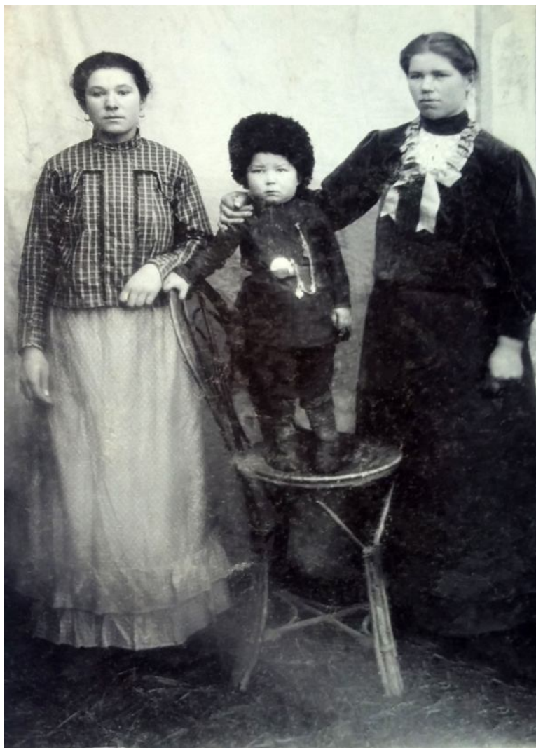
17. Терские казачки с ребенком. Фото начала XX в. из музея ст. Котляревской