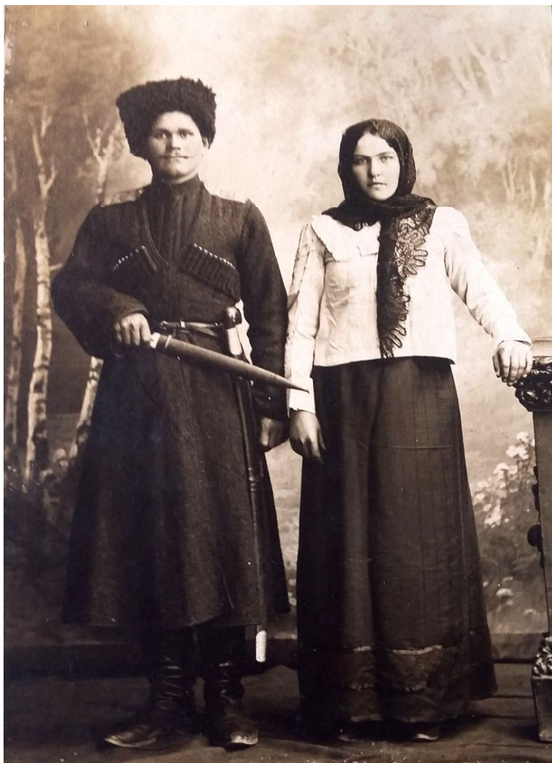
15. Терские казаки в начале XX в.