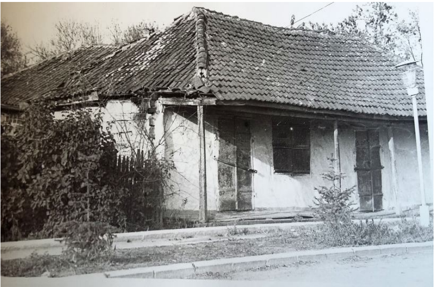
2. Традиционный казачий дом.