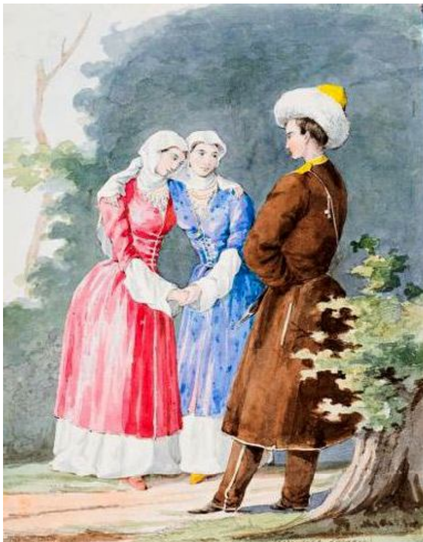
13. Гребенские казаки. Неизвестный художник. Середина XIX в. «Кавказский» альбом. Акварель. Государственный исторический музей. № И VII 1890/13