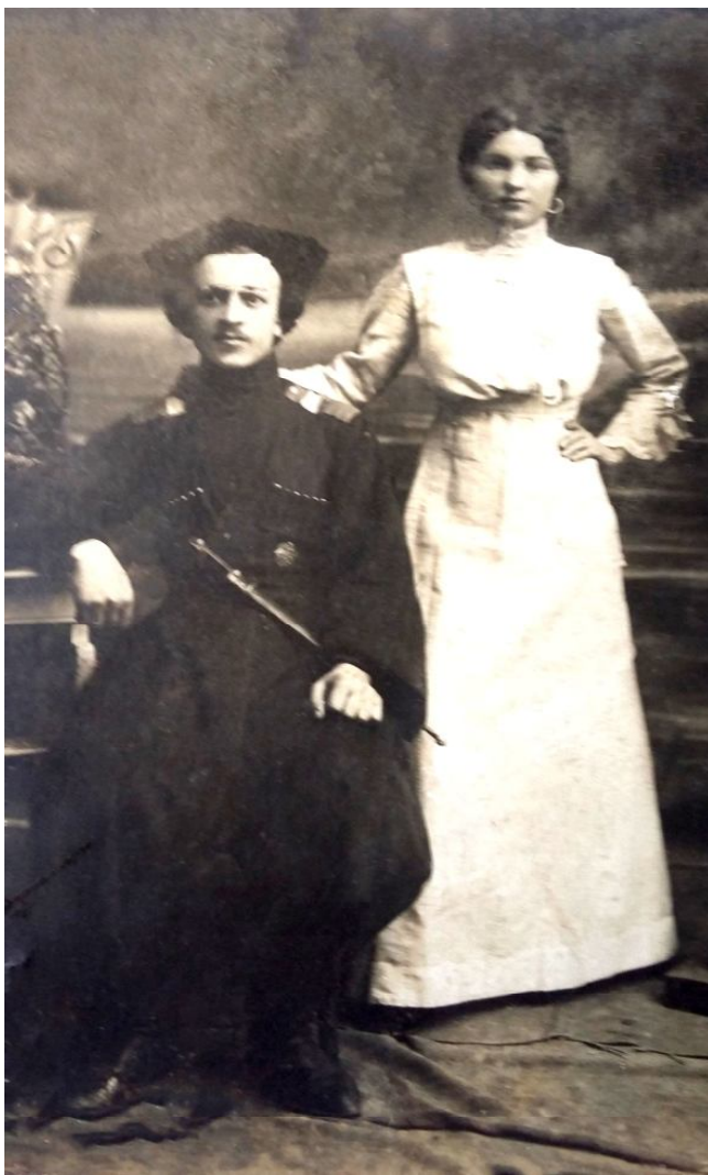
19. Терские казаки в начале XX в.