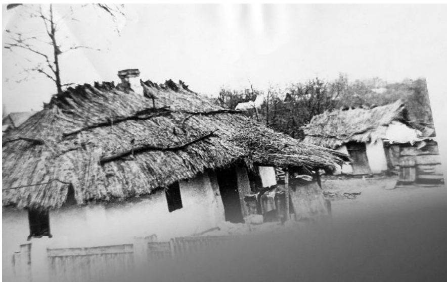
3. Традиционная хата.