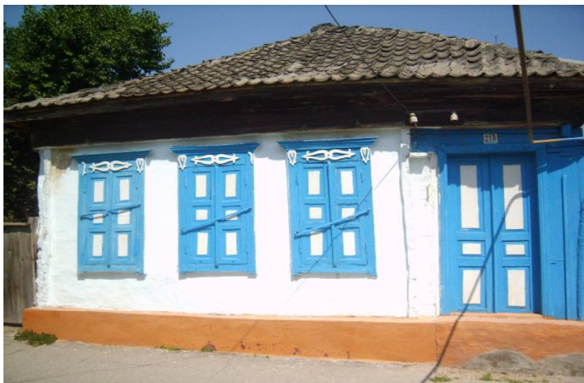
5. Традиционный казачий дом. Город Прохладный