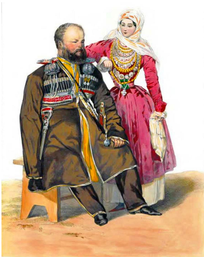
11. Офицер Кавказского линейного казачьего войска (Гребенского полка) с дочерью (Из альбома Г.Г. Гагарина «Scènes, paysages, moères et costumes du Caucase». Paris, 1845)